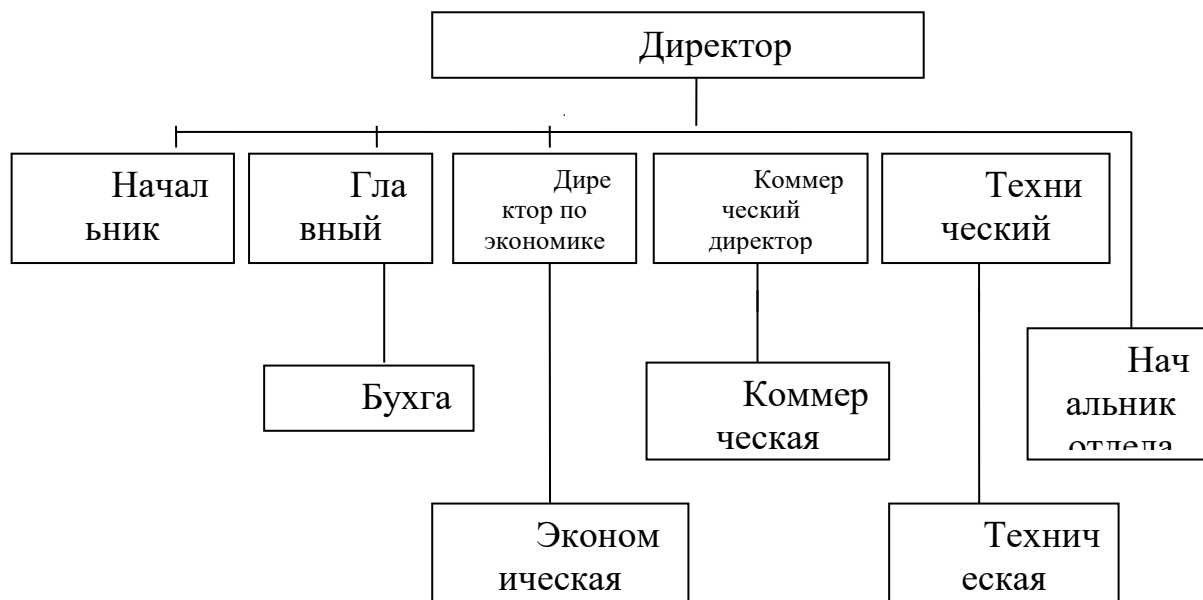
Рис. 1. Организационная схема ООО «Первая фирма»